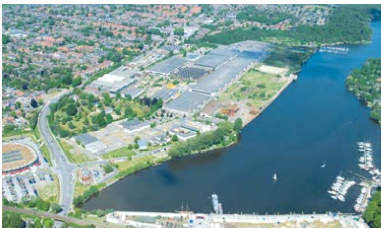
Sede Grupo ACO em Rendsburg/Büdelndorf