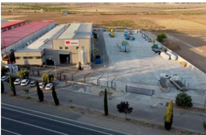
Sede ACO Remosa em Noblejas, Toledo, Espanha