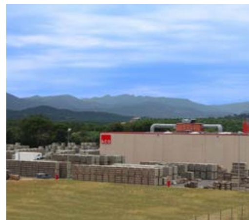
Sede ACO Iberia em Maçanet de la Selva, Girona, Espanha